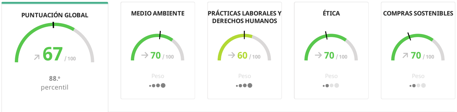
Distribución de la puntuación global